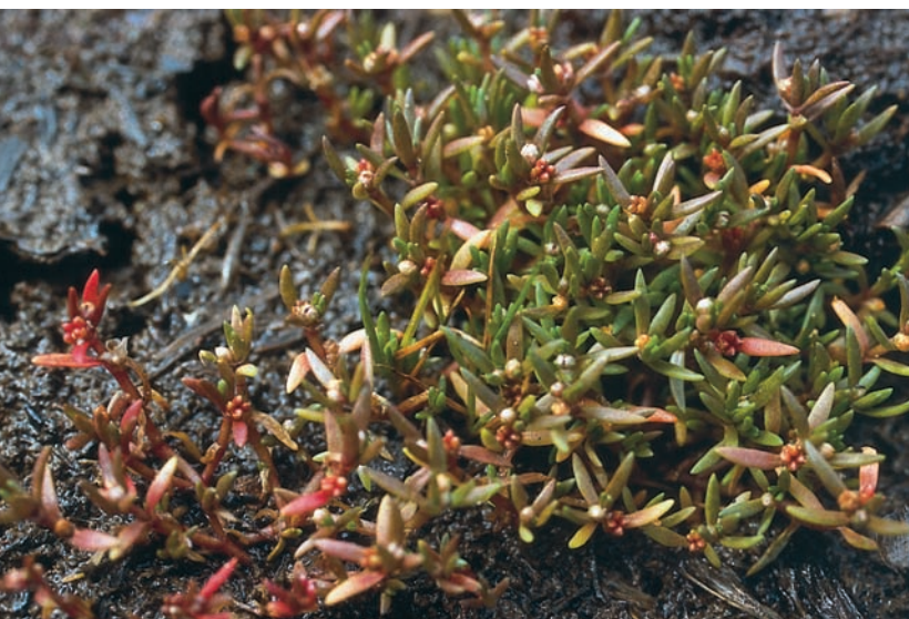
Fyrling Crassula aquatica förekommer här och där i de små hållkaren. Under torra somrar torkar många hållkar ut och då får man söka förgäves efter fyrlingen.

tima vanliga. Högre upp är växtligheten rikare med till exempel krusskräppa Rumex crispus , skörbjuggsört Cochlearia officinalis , strandkål Crambe maritima , backvial Lathyrus sylvestris , kärrtörel Euphorbia palustris , flädervänderot Valeriana sambucifolia , åkermolke Sonchus arvensis , backlök Allium oleraceum , sandlök A. vineale och strandråg Leymus arenarius , samt snår med slån Prunus spinosa , vresros Rosa rugosa och vildkaprifol Lonicera periclymenum .