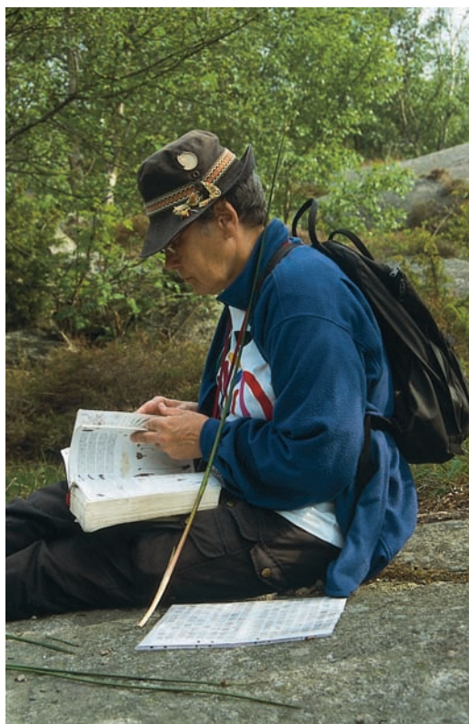
Vad kan det här vara? Författaren examinerar.

Av återfunna taxa har 38 (7 %) klassats som ökande (tabell 2). I och med forskningen på de större öarna har arter som till exempel alm Ulmus glabra , oxel Sorbus intermedia , lingon Vaccinium vitis-idaea , jordreva Glechoma hederacea , fläder Sambucus nigra och skogssallat Mycelis muralis ökat. Ökat har också kulturbundna arter som tomtskräppa Rumex obtusifolius , åkerkårel Erysimum cheiranthoides , humlelusern Medicago lupulina och skatnäva Erodium cicutarium . Två arter som är starkt ökande på hela Västkusten, och även i Styrös socken, är strandbeta Beta vulgaris ssp. maritima och strandmalört Seriphidium maritimum . Man kan nästan se hur de utökar sina revir från år till år. Allmänt ökande är också palsternacka Pastinaca sativa och rosendunört Epilobium hirsutum .